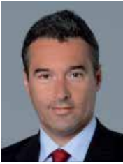
Francesco SANDRINI CIO Italy & Global Head of Multi-Asset

I recenti eventi nel Medio Oriente ci hanno indotto a fare un passo indietro e a rivalutare l'evoluzione attesa delle nostre strategie di lungo periodo. Siamo convinti che sarà la durata del periodo in cui i prezzi energetici rimarranno elevati a definire il grado di trasmissione degli effetti della crisi all'economia. Se da un lato i nostri indicatori macroeconomici segnalano che siamo ancora in una fase matura del ciclo, dall'altro non riflettono integralmente le implicazioni di una crisi prolungata. Pertanto, in un'ottica di breve periodo, abbiamo ridotto l'esposizione direzionale alle asset class più rischiose, ritenendo al contempo necessario rafforzare le strategie di copertura, in particolare sul comparto azionario dei mercati sviluppati. Nel complesso, resta importante mantenere un adeguato livello di diversificazione, tenendo conto che alcuni movimenti di mercato potrebbero essere stati eccessivi.